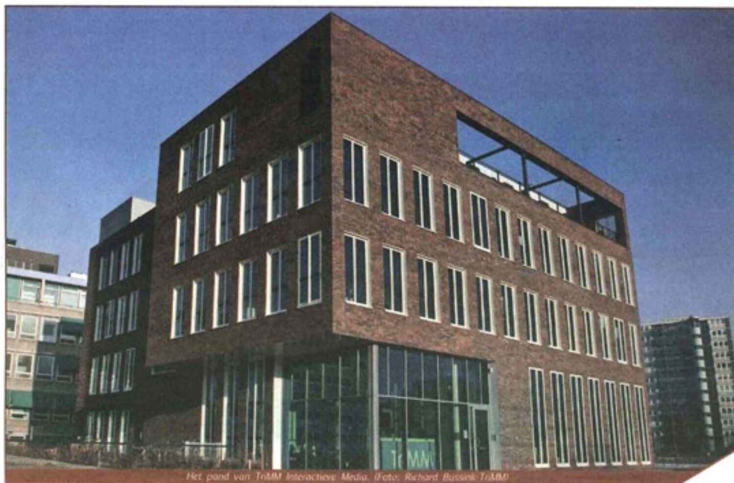
Het pand van TriMM Interactieve Media.